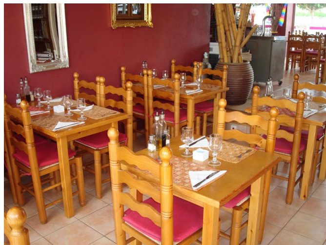
Vista del comedor