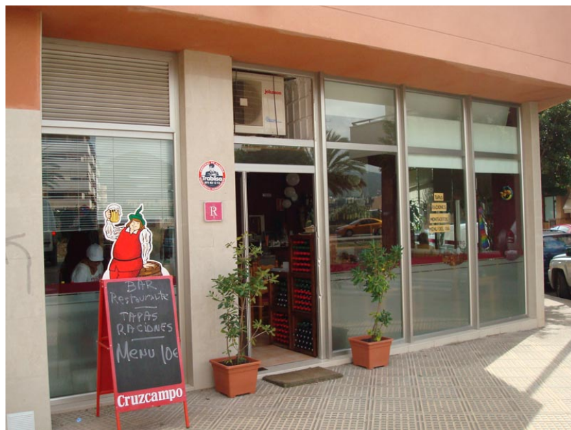
Fachada del establecimiento