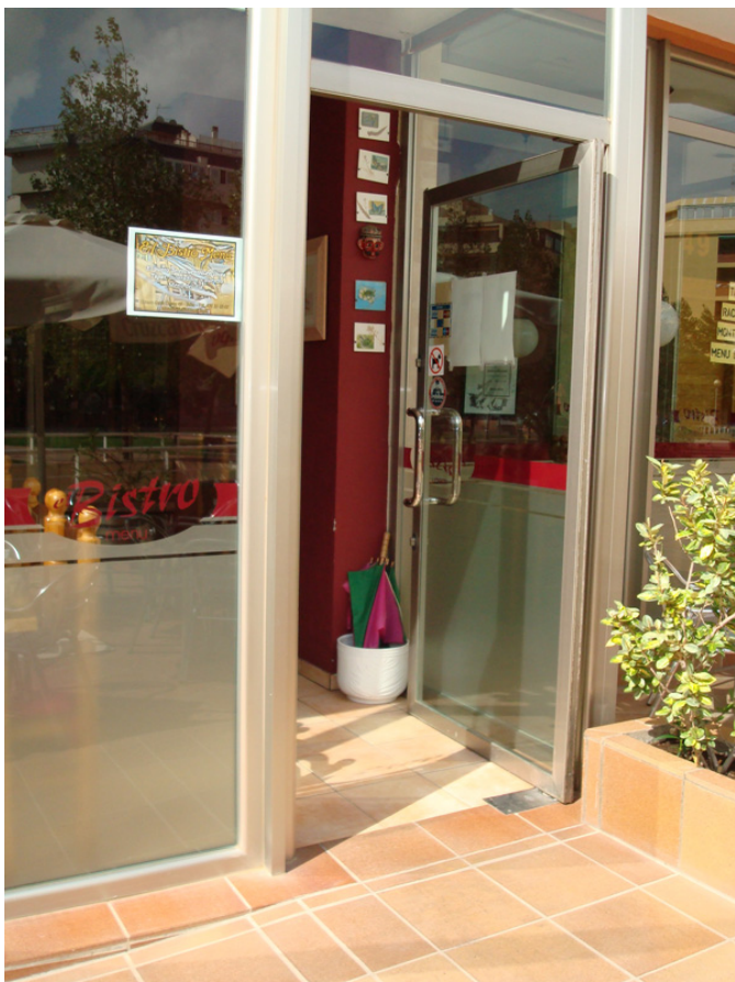
Acceso al establecimiento