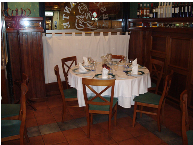
Vista del salón comedor