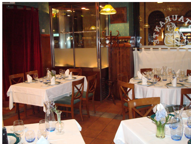
Vista del salón comedor