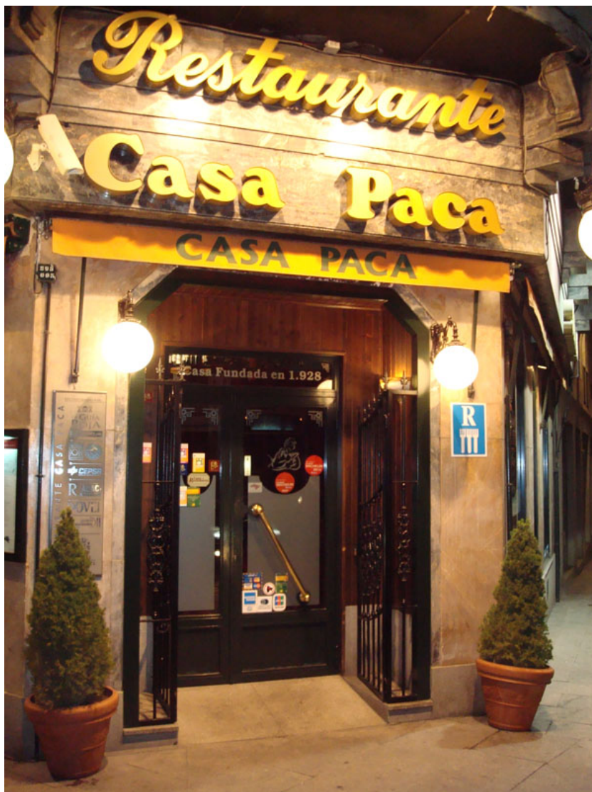
Acceso del establecimiento