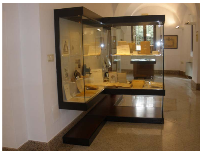
Vitrinas de la exposición