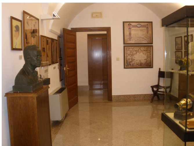
Interior de la exposición