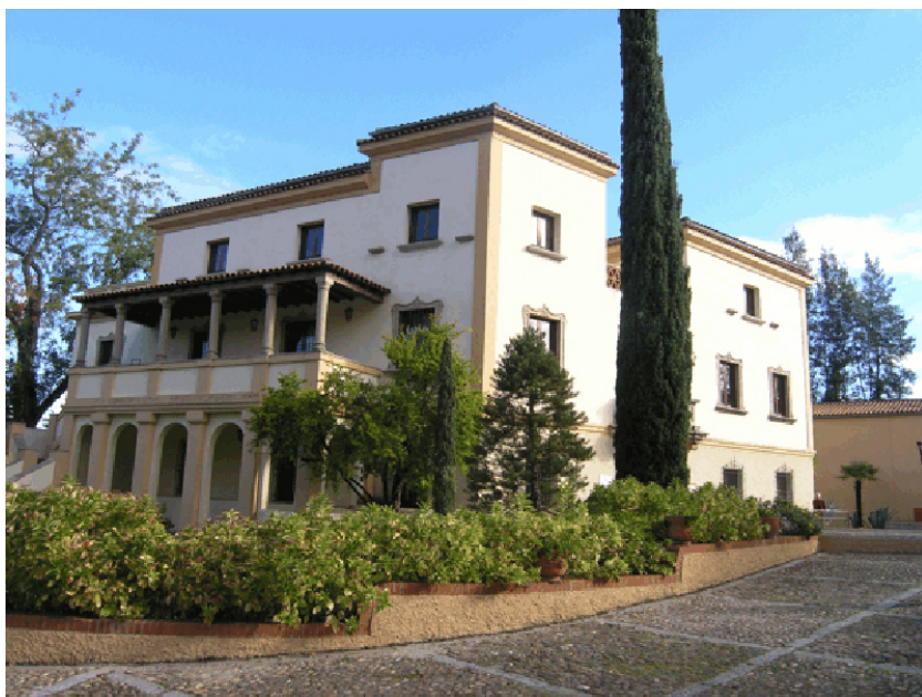
Edificio del museo