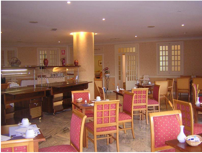
Zona de comedor