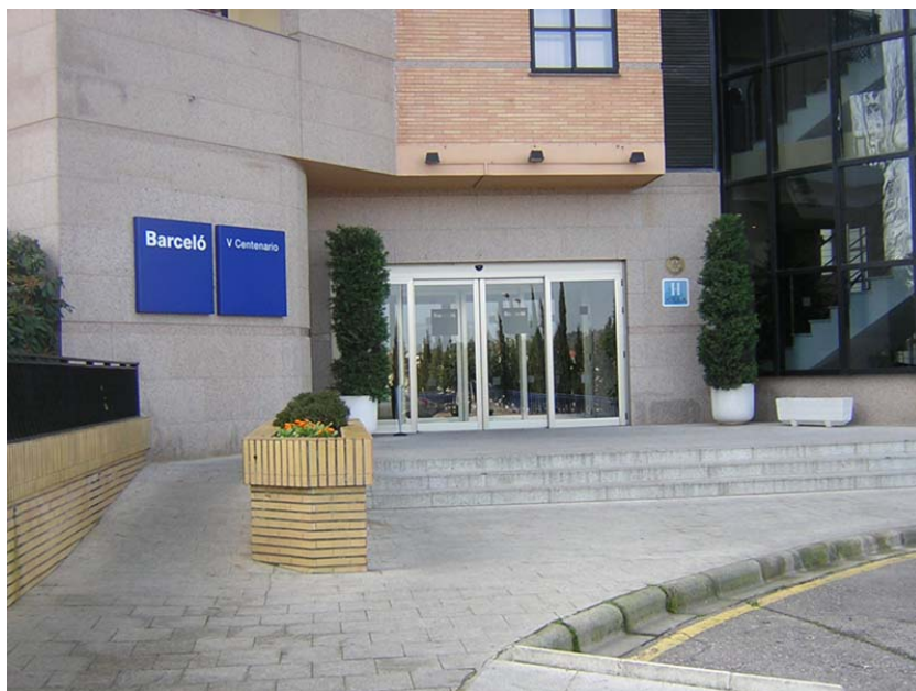
Entrada principal con rampa de acceso

Dirección: Manuel Pacheco, s/n. Urbanización Castellanos 10005 Cáceres (Cáceres) Teléfono: 927232200 Web: www.barcelo.com