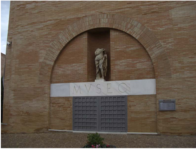
Fachada exterior del museo