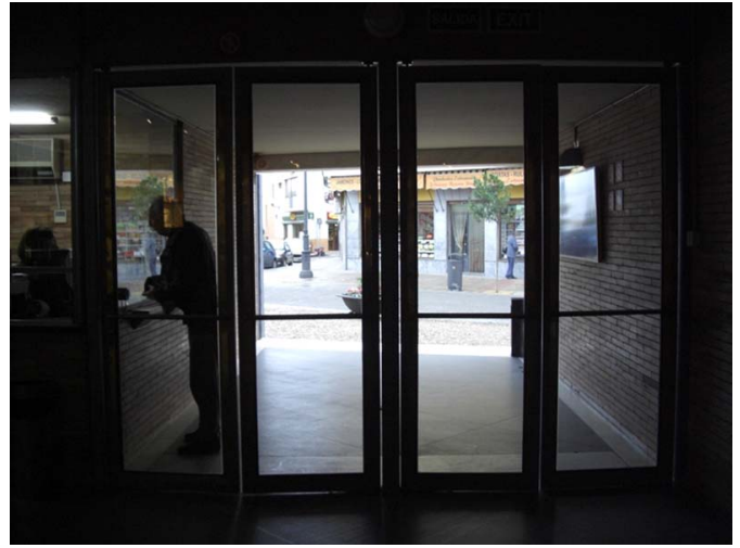
Entrada y mostrador de atención