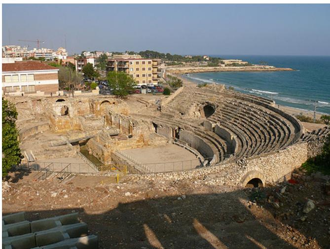
Vista aérea del circo