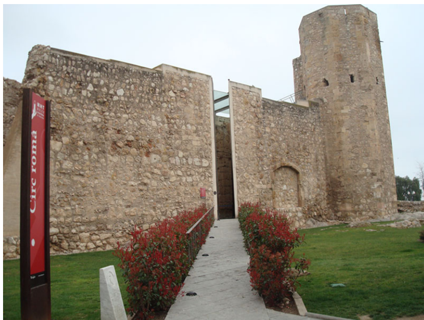
Restos arqueológicos dedicados a museo