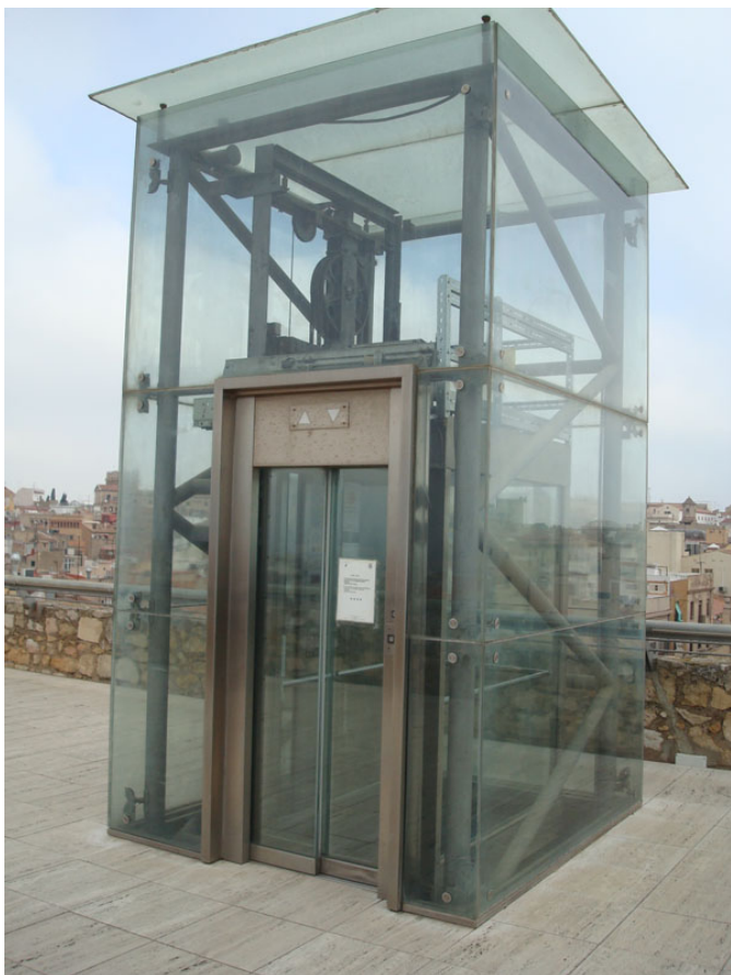
Ascensor para acceder al circo