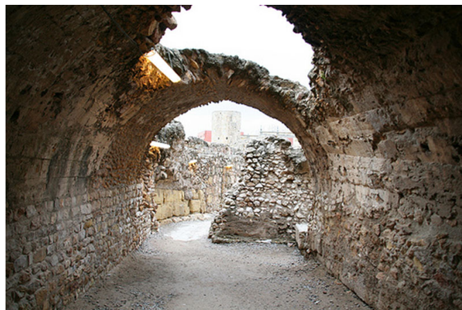
Interior de los vomitorios