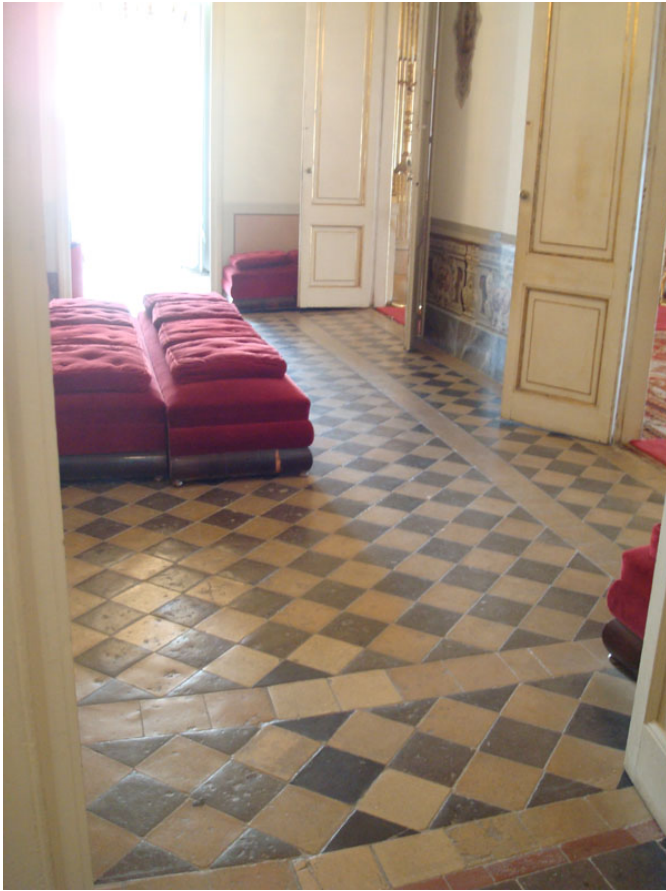
Habitaciones de la casa