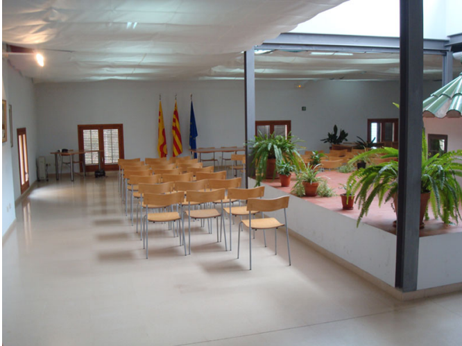
Aula de conferencias