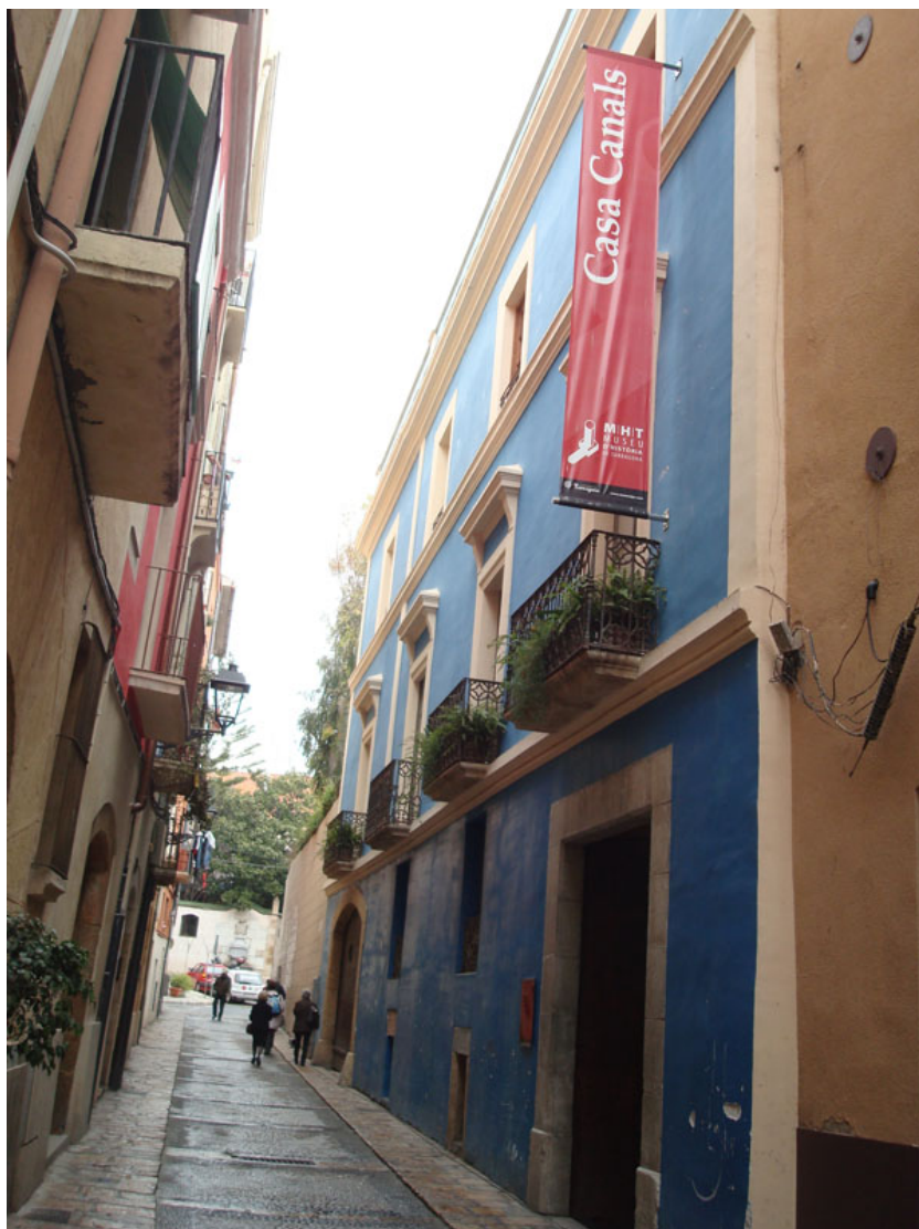
Fachada del edificio