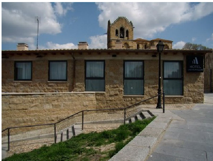
Fachada del Hotel