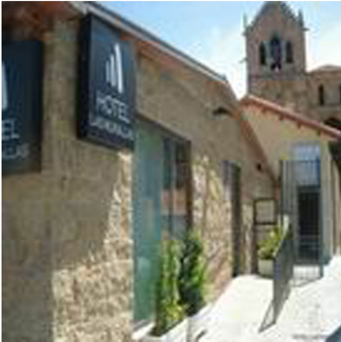
Rampa de acceso