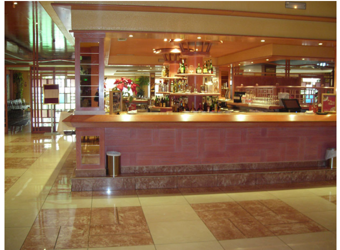
Cafetería del hotel