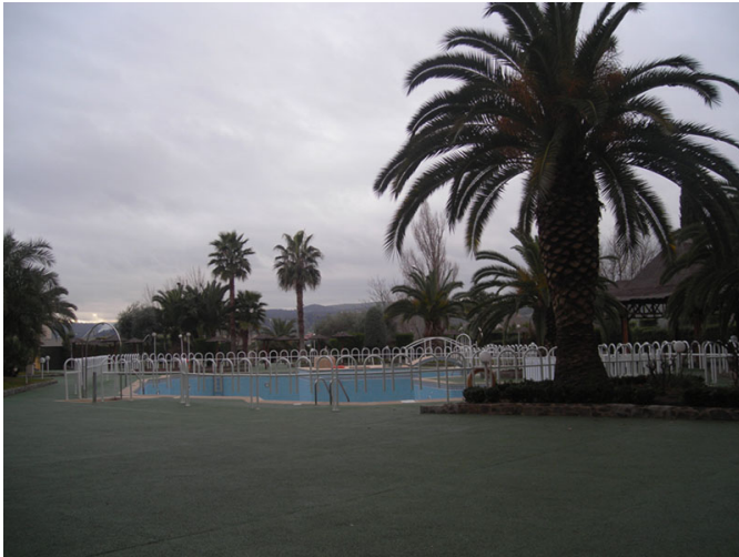
Zona de terraza y piscina