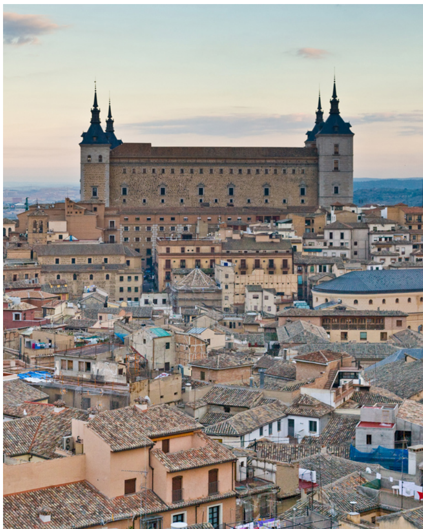
Vista panorámica del Alcázar