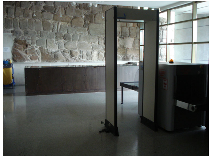
Área de atención y arcos de seguridad