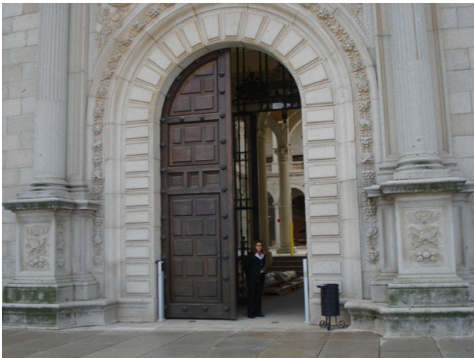
Puerta principal de acceso