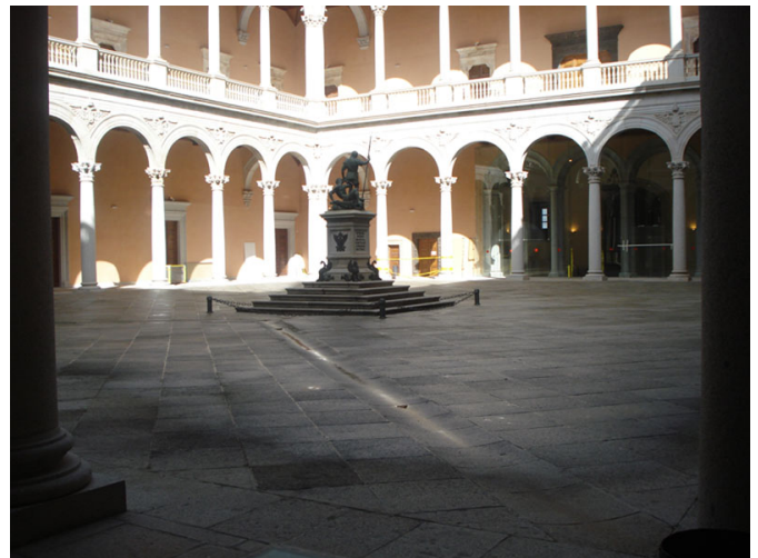
Patio interior con arcadas en dos alturas