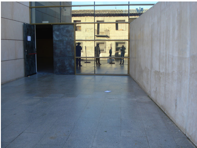
Acceso a zona de museo