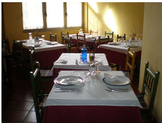
Vista del comedor