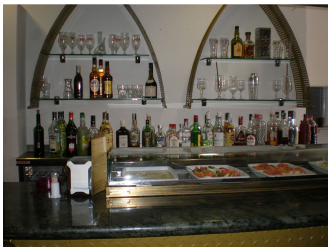
Barra del bar