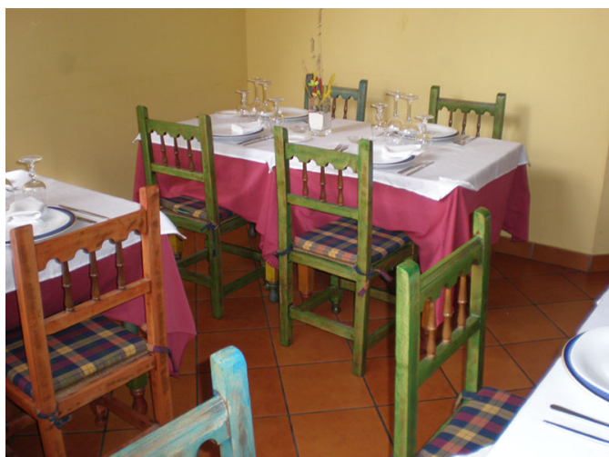
Vista del comedor