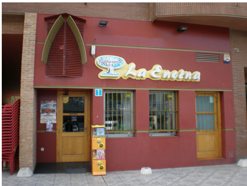
Fachada y acceso al establecimiento