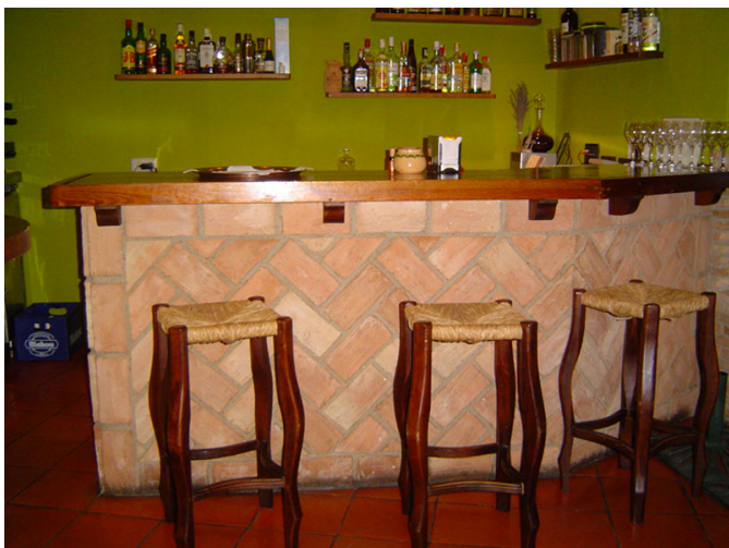
Mesa del comedor