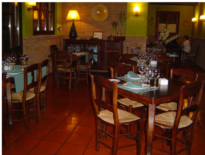
Vista del Salón