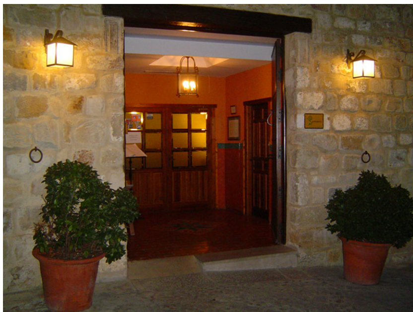
Fachada del establecimiento