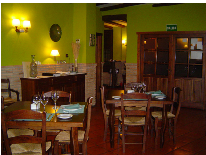
Exteriores de la Sabina de las Lagunillas