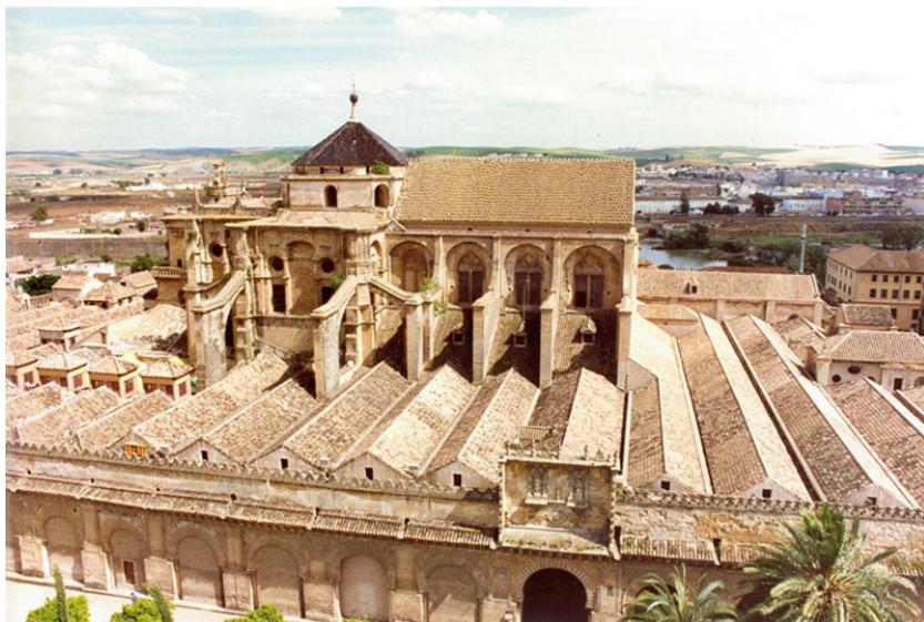
Vista aérea de la Catedral y Antigua Mezquita