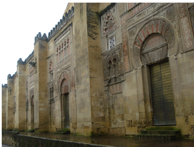
Vista lateral de La mezquita, con Arcos Árabes