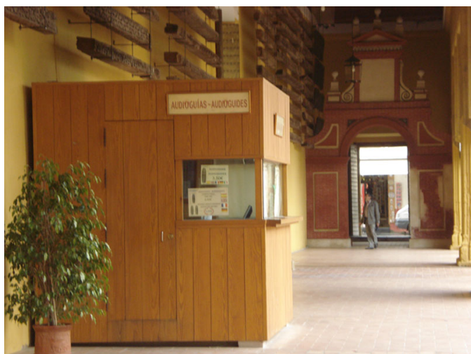
Taquillas de entada y adquisición de audioguías