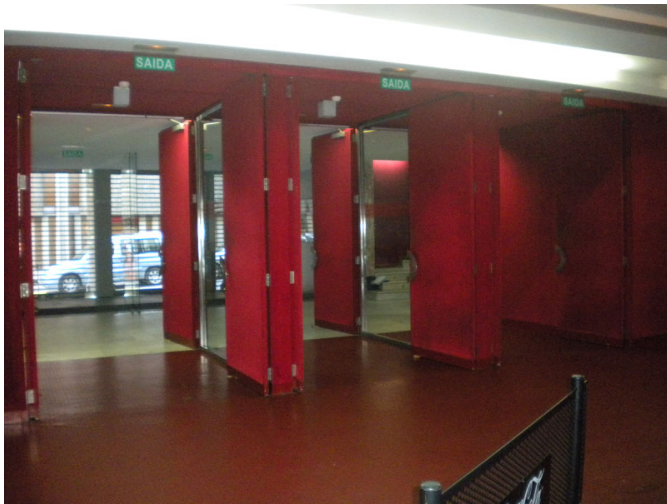
Hall de entrada