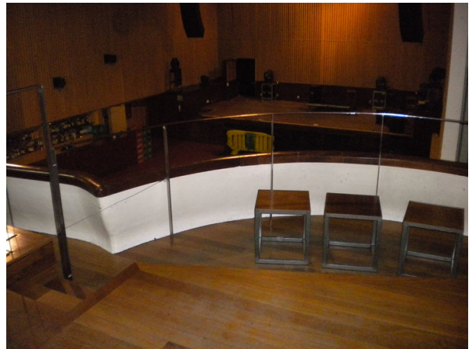
Interior de la sala y espacio reservado a PMR