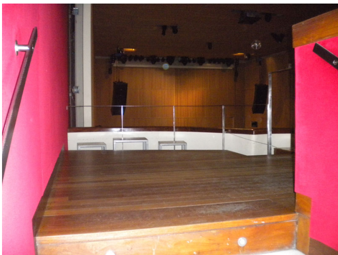
Interior de la sala