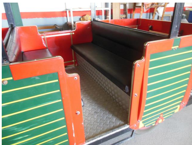
Paso en vagón estándar