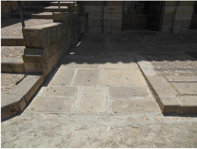
Rebaje de acera de la oficina