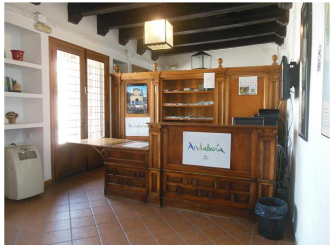
Mostrador de atención