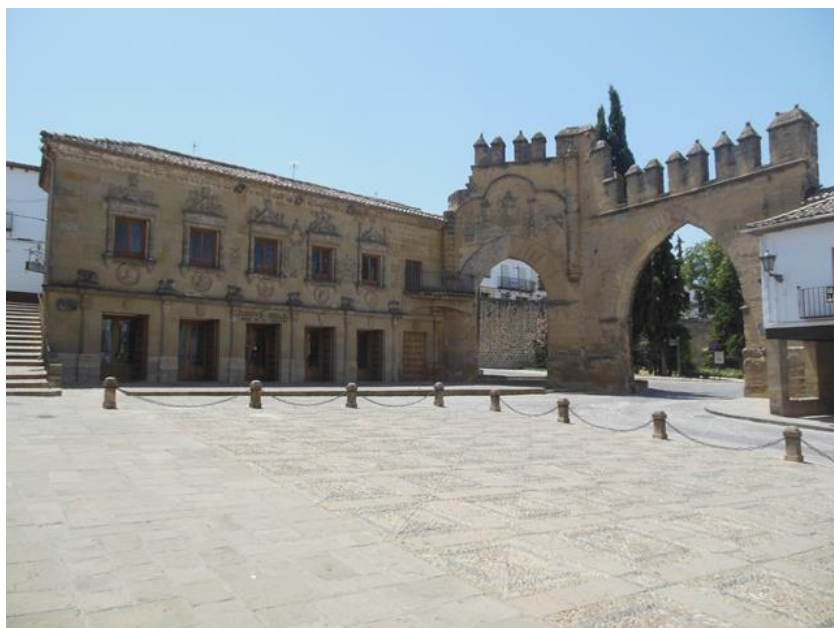
Fachada del edificio de la oficina