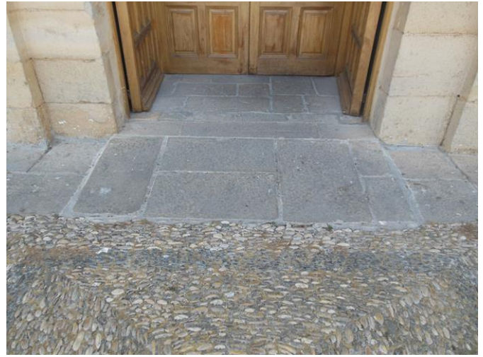
Rebaje de la entrada