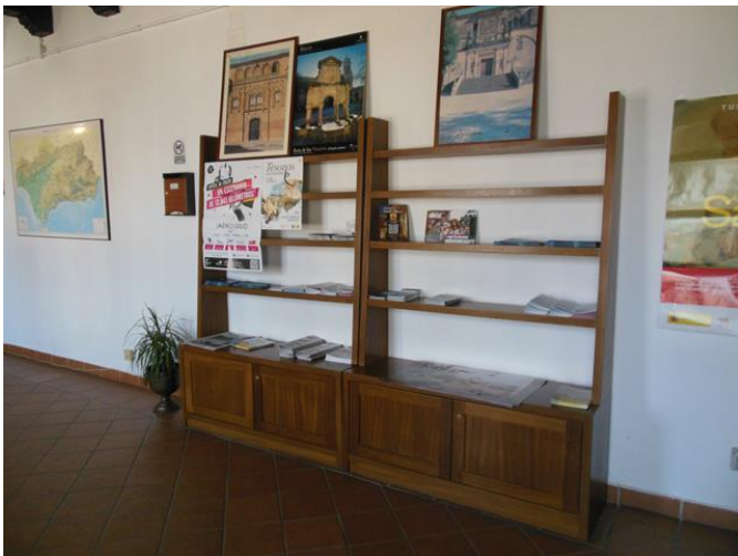
Estanterías con folletos