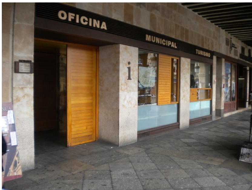
Fachada del edificio