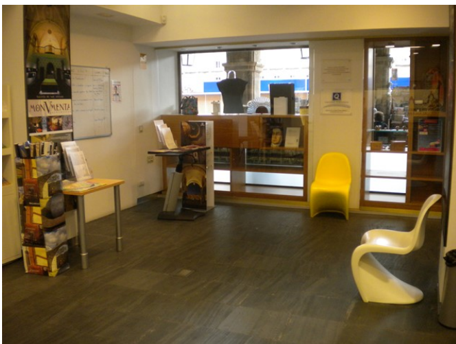
Zona de espera