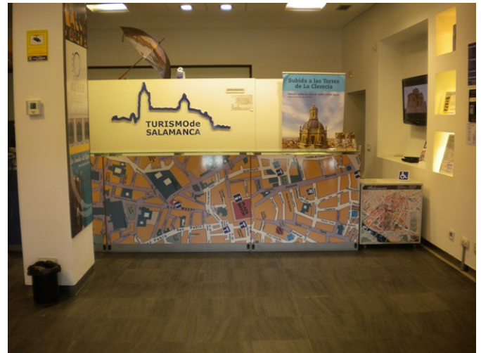
Mostrador de atención al público