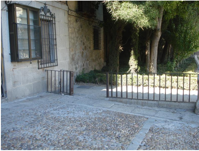
Plaza de acceso