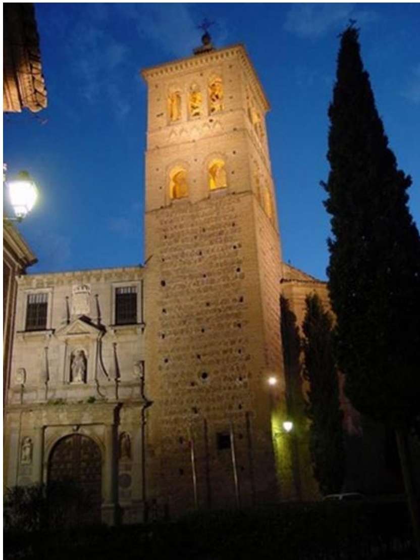
Iglesia de San Román