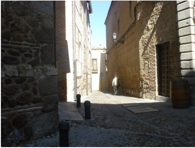
Calle de acceso al Museo