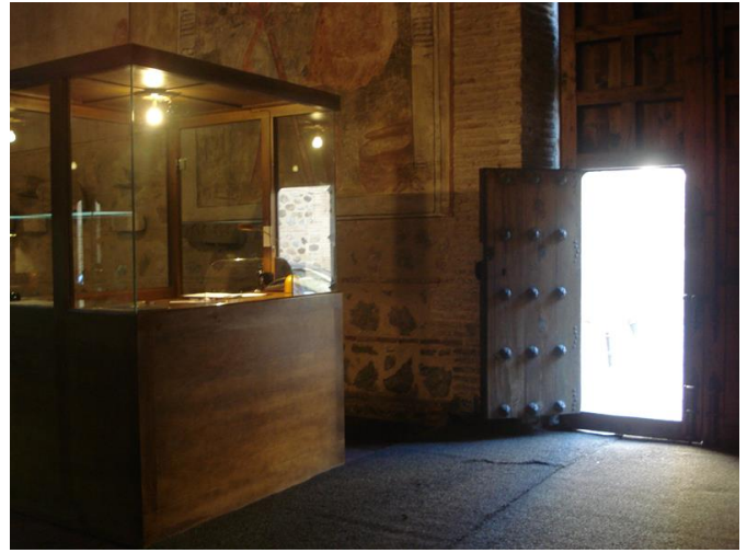
Acceso y recepción