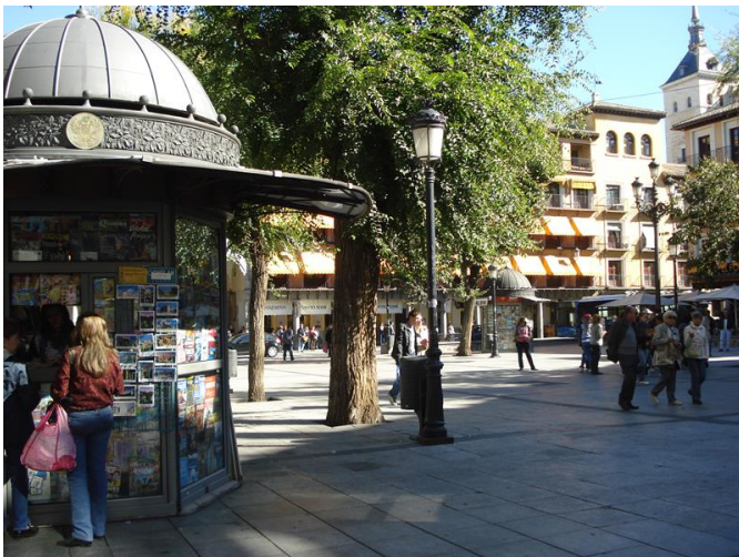
Plaza de Zocodover