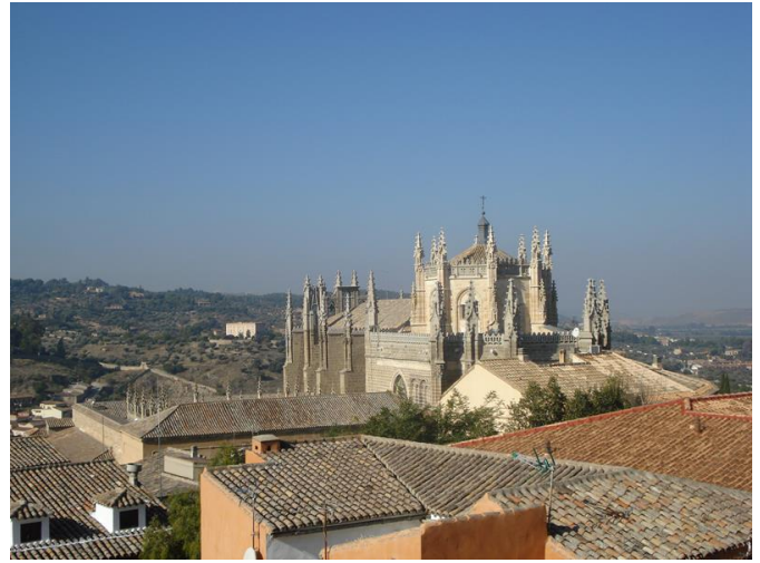
Vista desde calle Santo Tomé