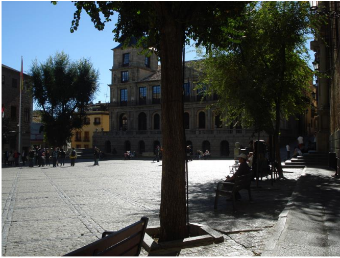
Calle de la Trinidad