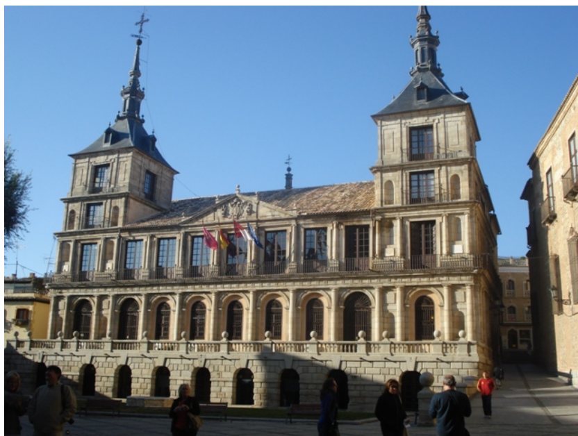
Fachada del Ayuntamiento de Toledo