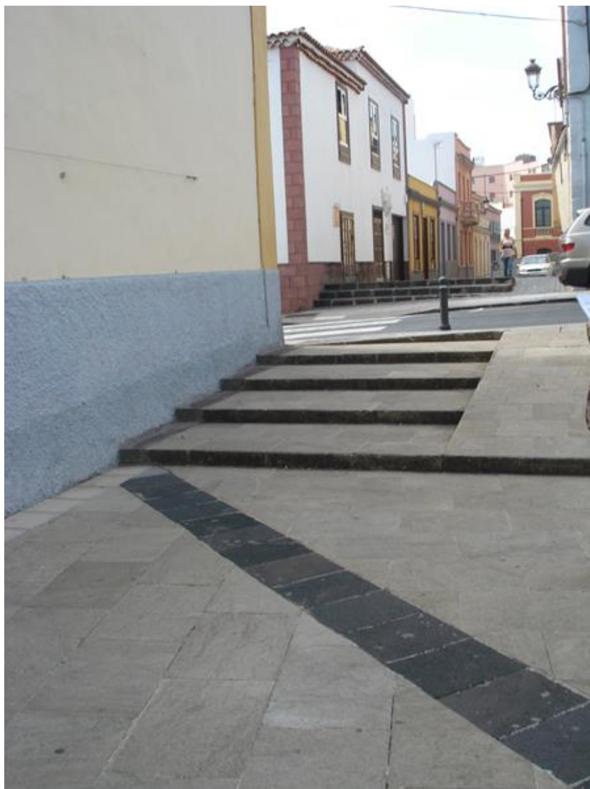
Acceso a la plaza