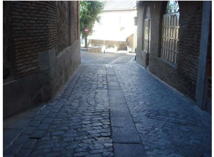
Itinerario alternativo de acceso