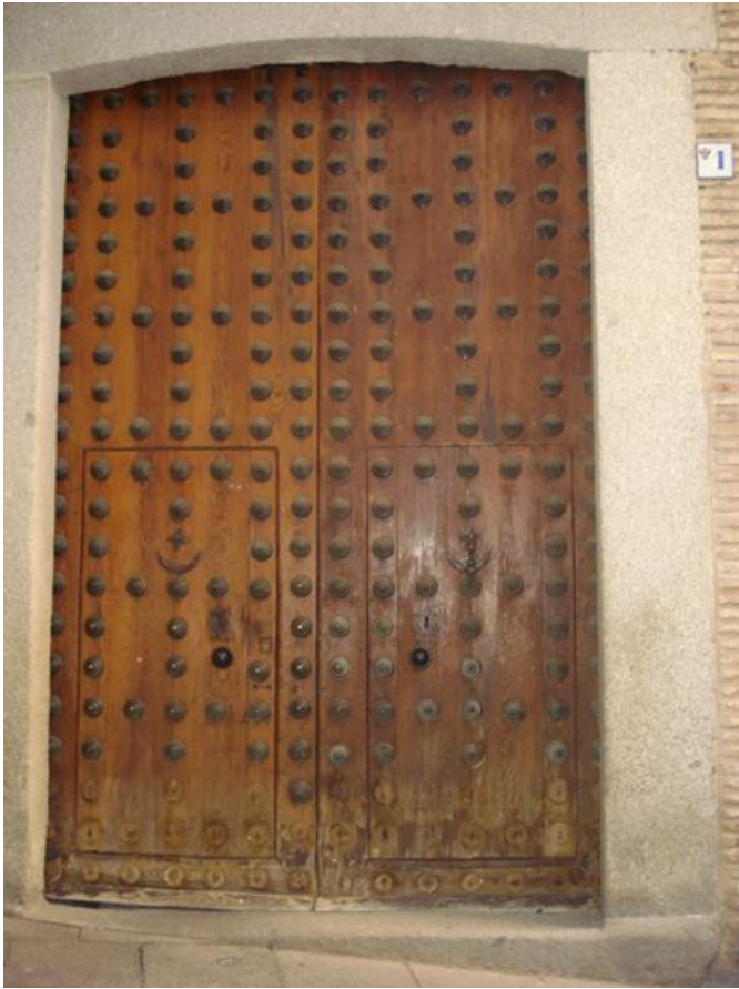
Itinerario alternativo de acceso