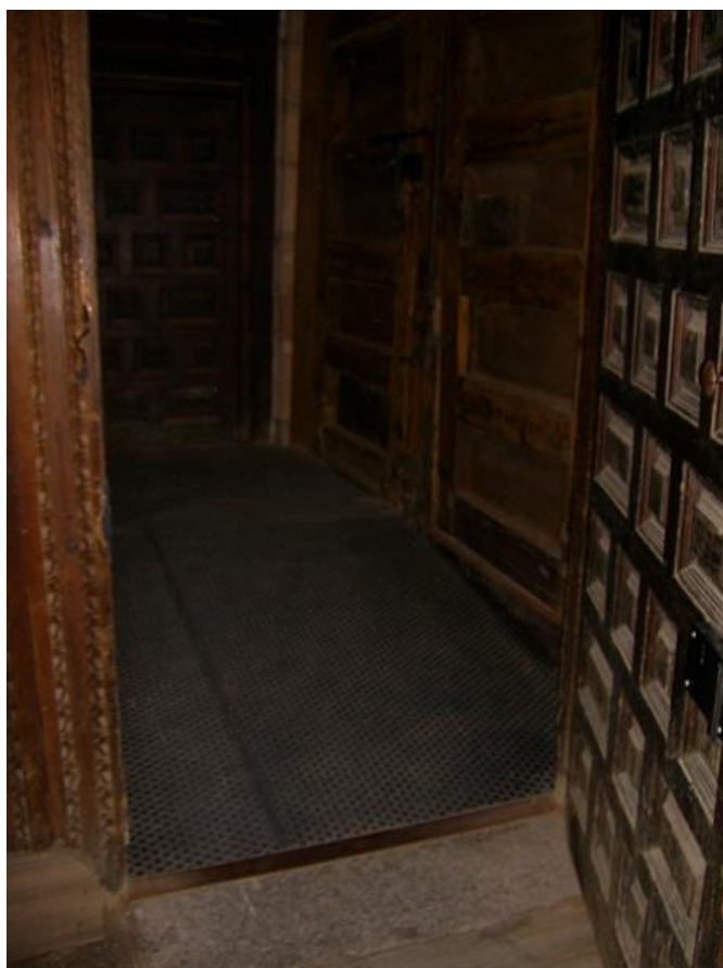
Puerta de acceso