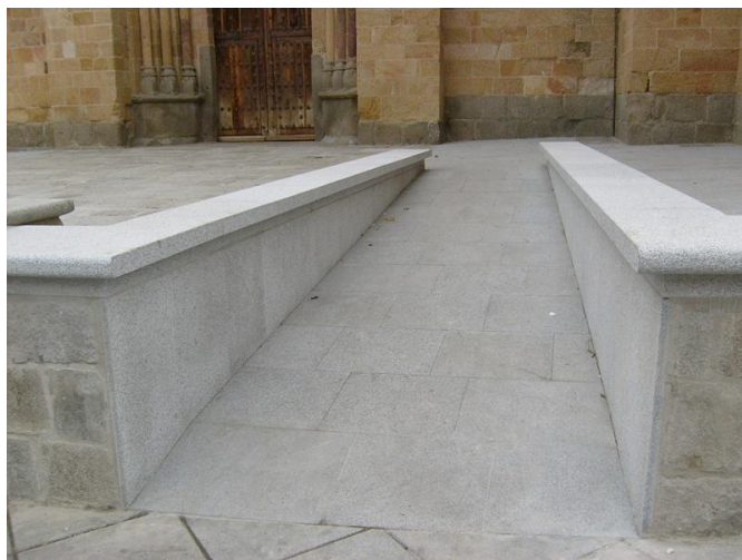
Rampa de acceso