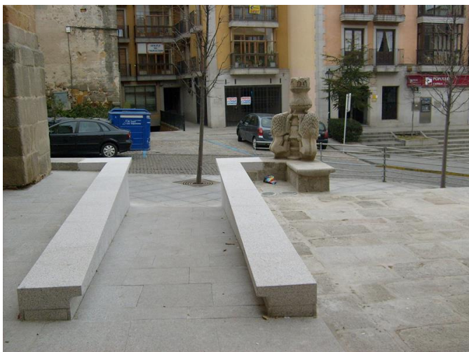
Rampa de acceso