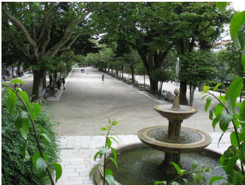
Vista interior del Parque