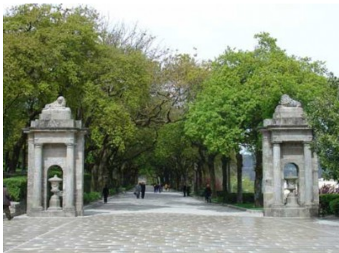
Entrada lateral de acceso al parque