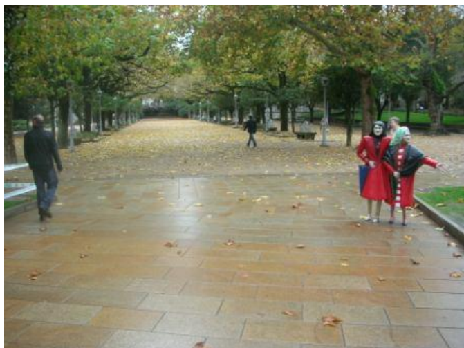
Interior del parque