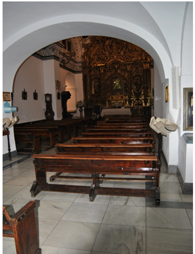
Interior del Santuario