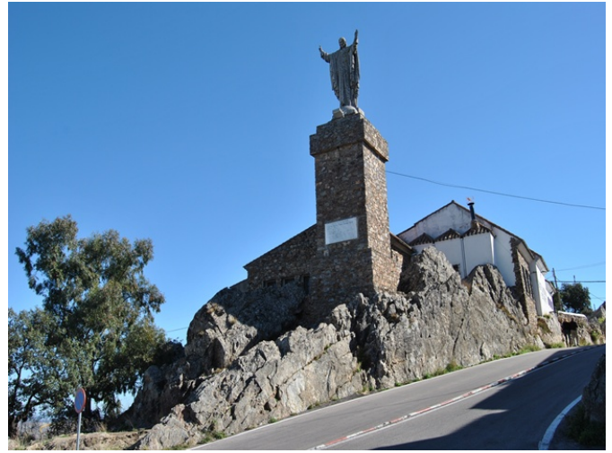
Rampa y vista exterior del Santuario