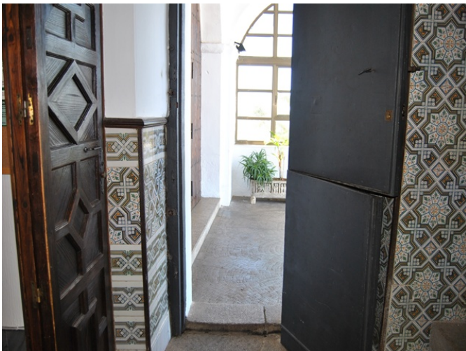
Acceso al templo