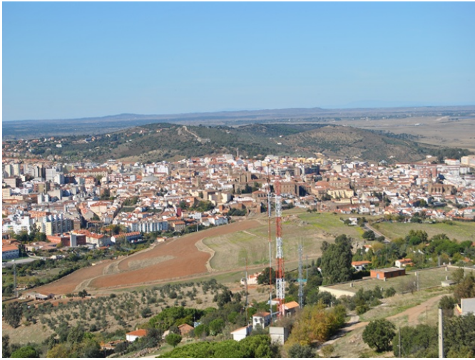
Vistas desde el mirador