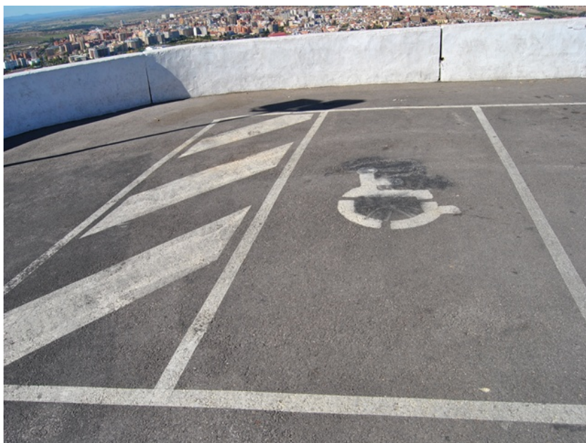
Plaza de aparcamiento reservada para PMR