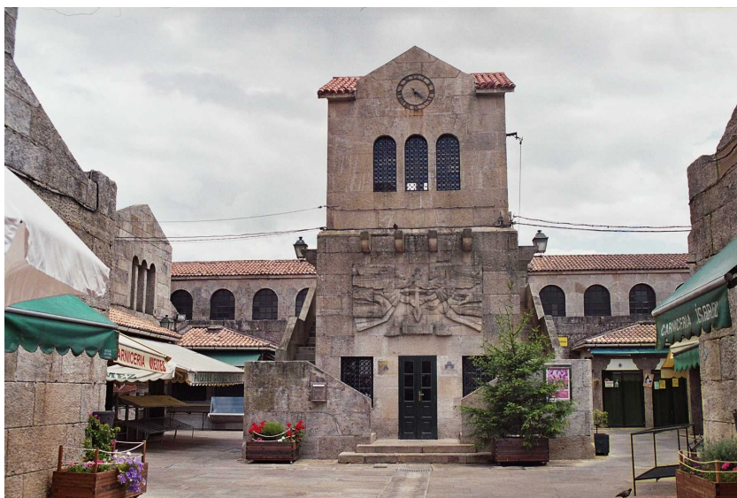
Fachada del establecimiento