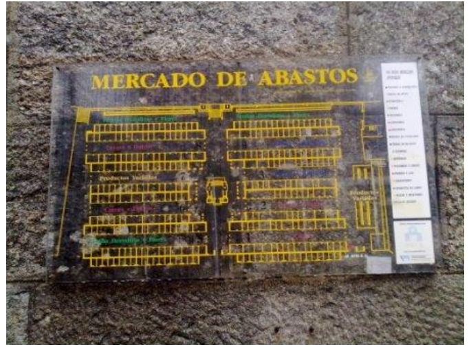
Señalización del mercado