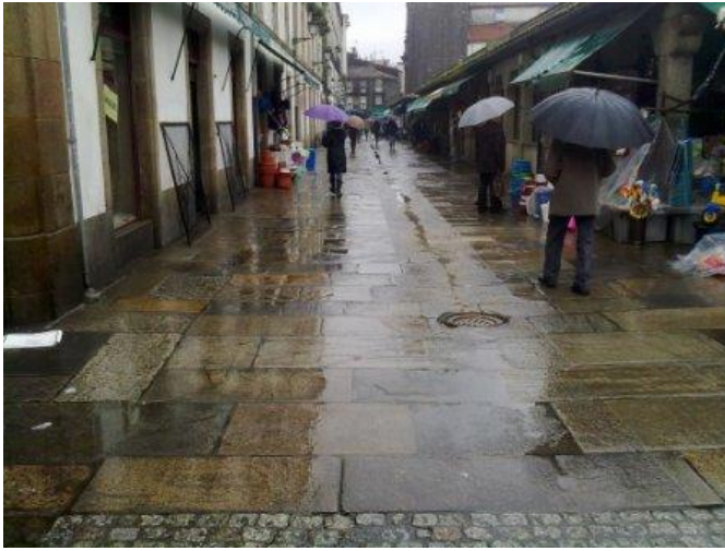
Vista general del mercado