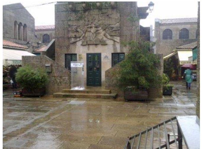
Vista general del mercado