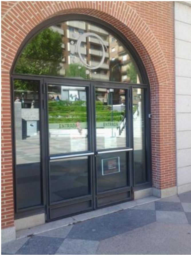
Puerta de entrada al interior del museo.