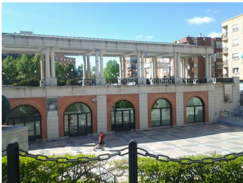
Fachada principal del edificio.