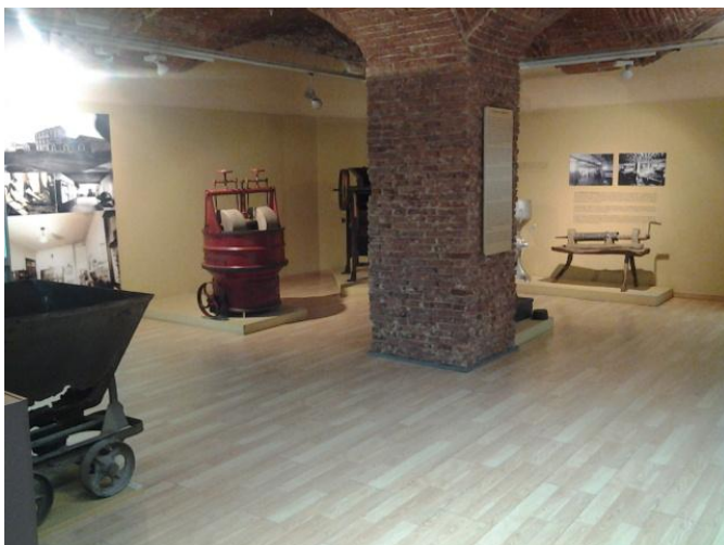
Circulación por el interior de la exposición.