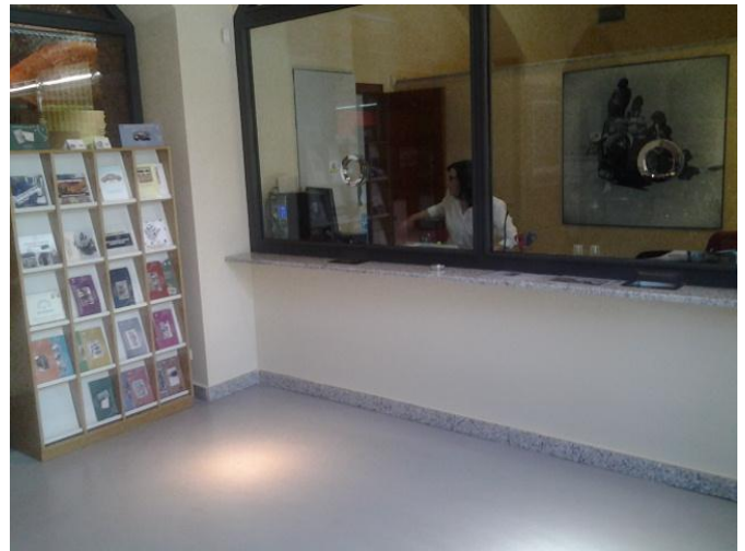
Mostrador de recepción y taquilla.