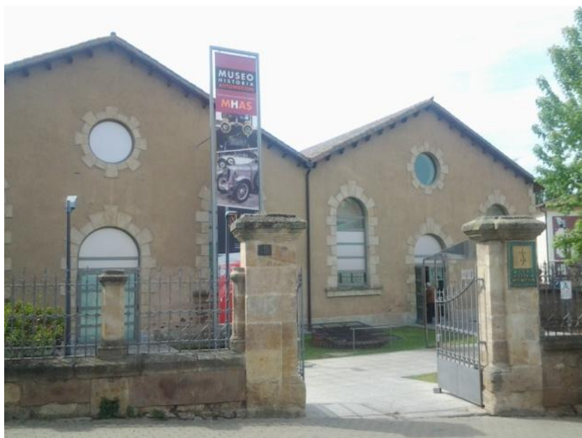
Fachada principal y acceso al edificio.