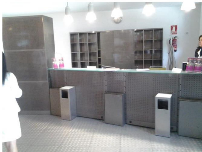
Mostrador de recepción y taquilla.