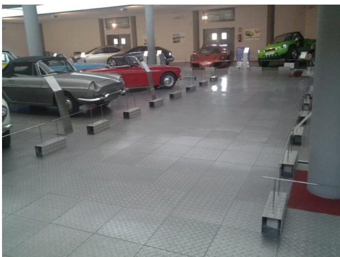
Circulación por el interior de la exposición.