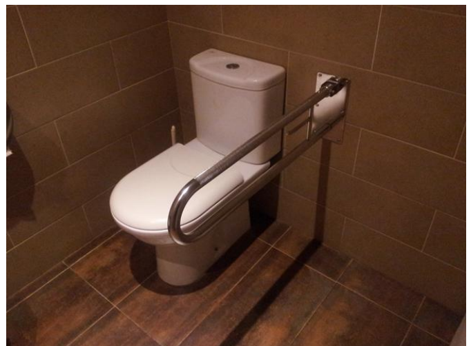
Aseo adaptado para PMR