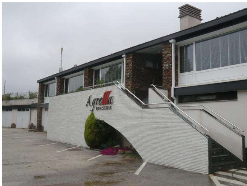
Fachada y entorno del edificio