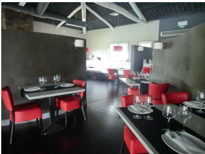
zona de masas, salón comedor