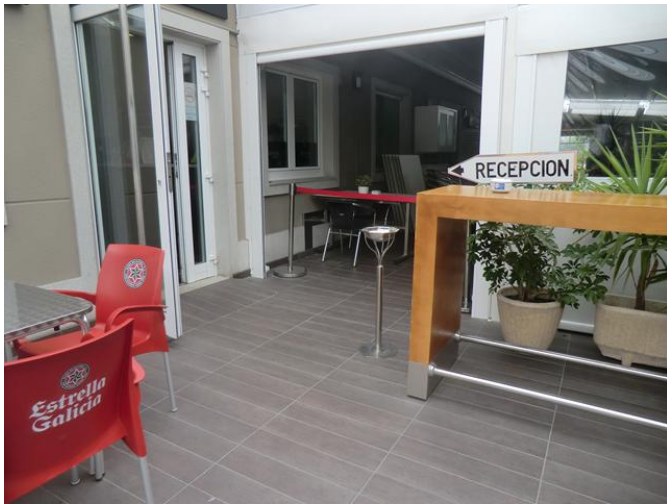
Puerta de acceso al interior del restaurante