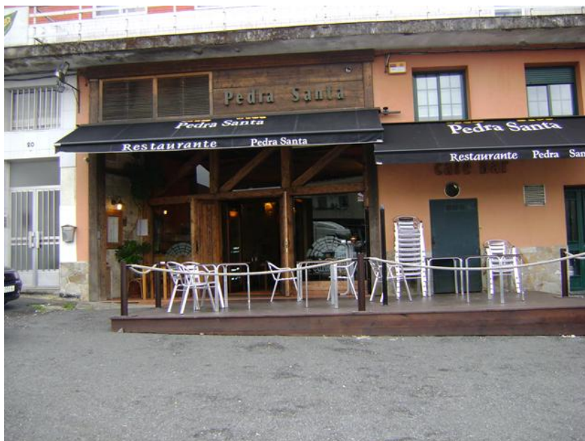
Fachada y entorno del edificio