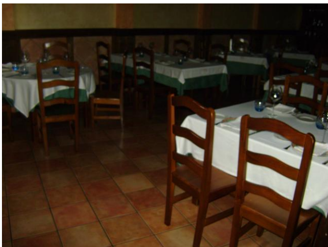
zona de masas, salón comedor