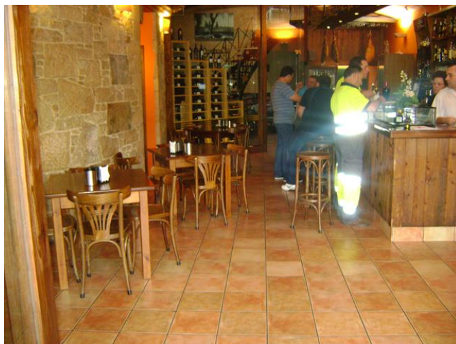
Zona de barra