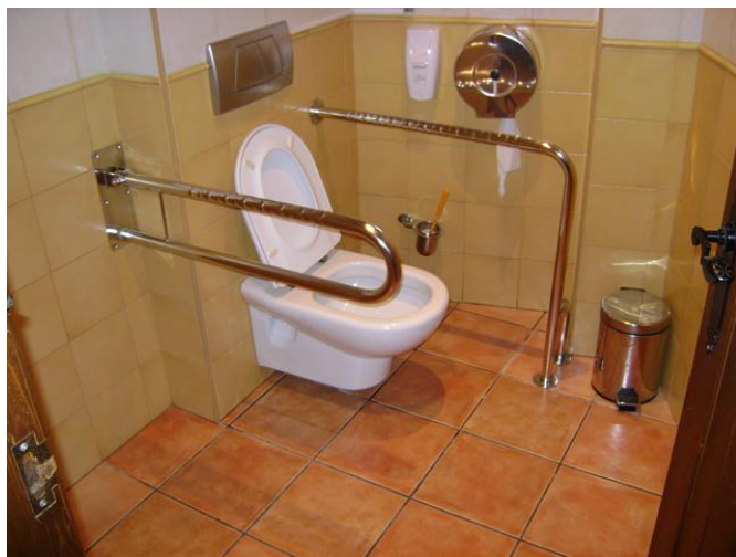
Aseo adaptado para PMR