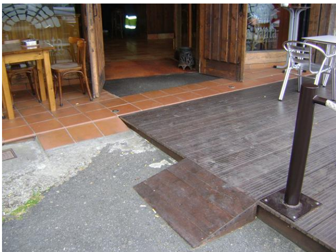
Acceso a la puerta de entrada al restaurante