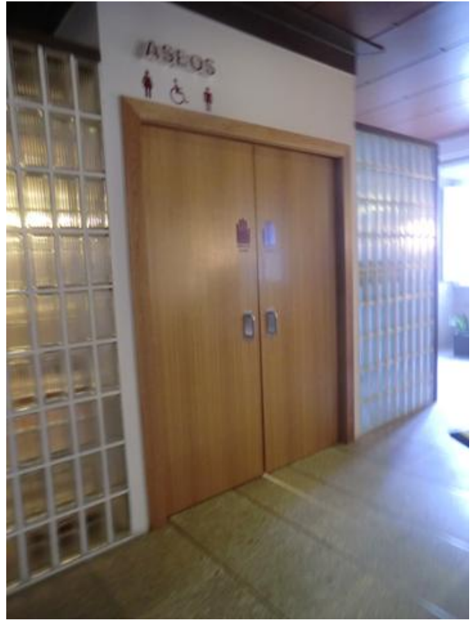
Señalética y circulación interior