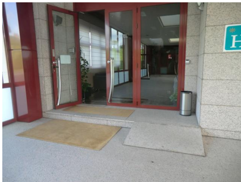
Puerta de acceso al restaurante