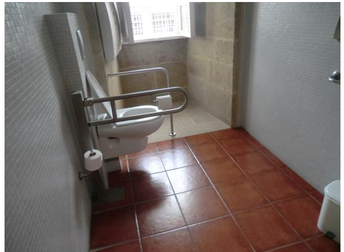
Aseo adaptado para PMR