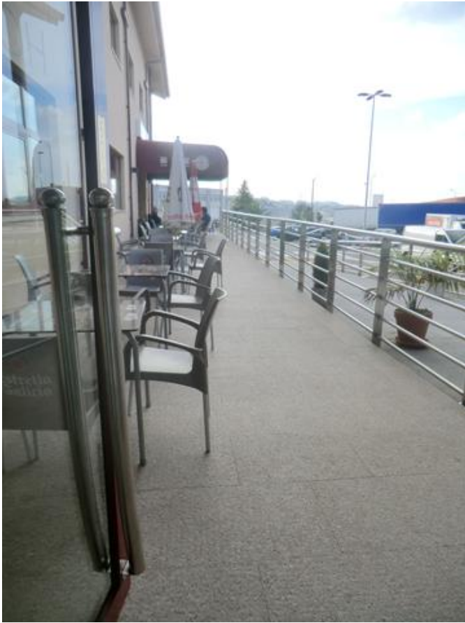
Entorno del restaurante