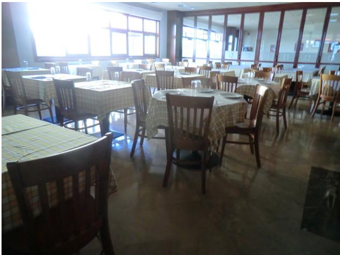
zona de masas, salón comedor