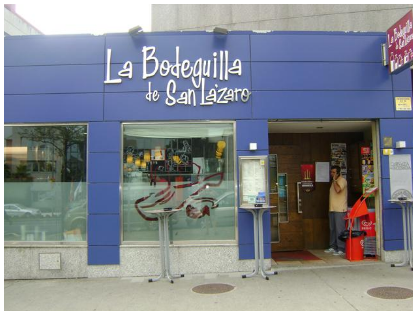
Fachada del restaurante