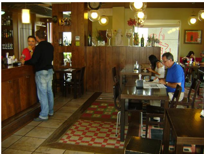
Zona de barra