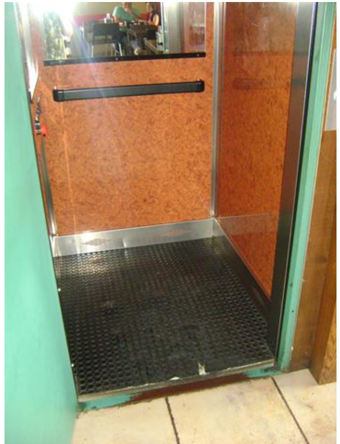
Cabina del ascensor