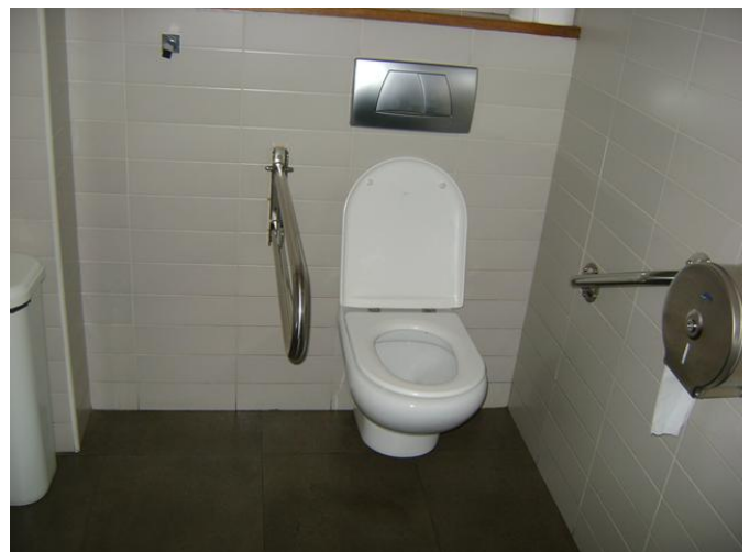
Aseo adaptado para PMR