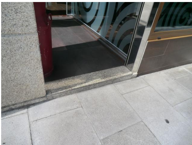
Puerta de acceso al interior del restaurante