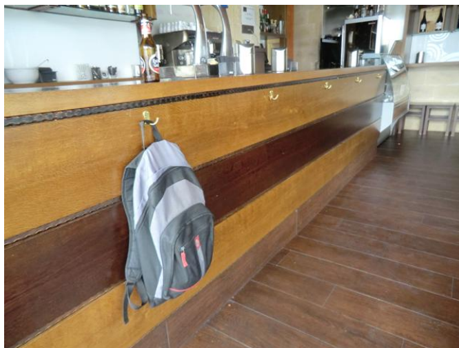
Zona de bar