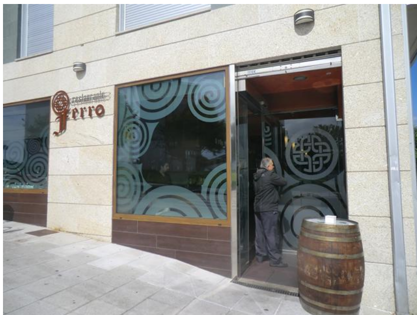
Fachada del restaurante