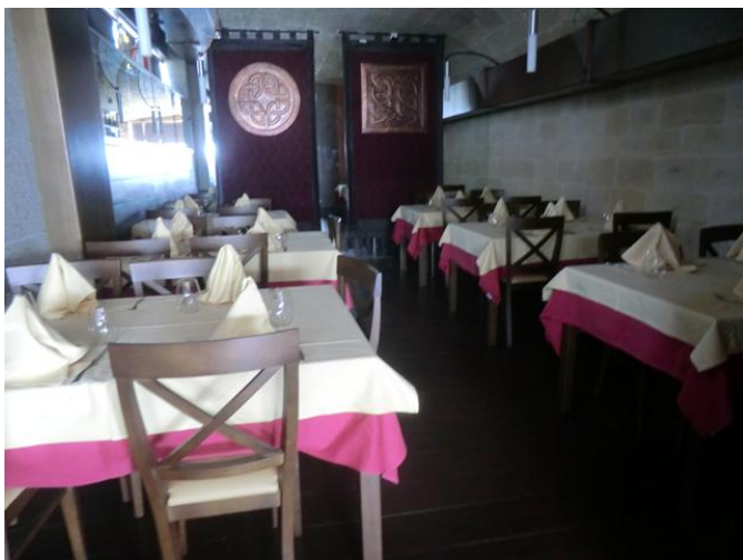
zona de masas, salón comedor