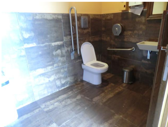
Aseo adaptado para PMR