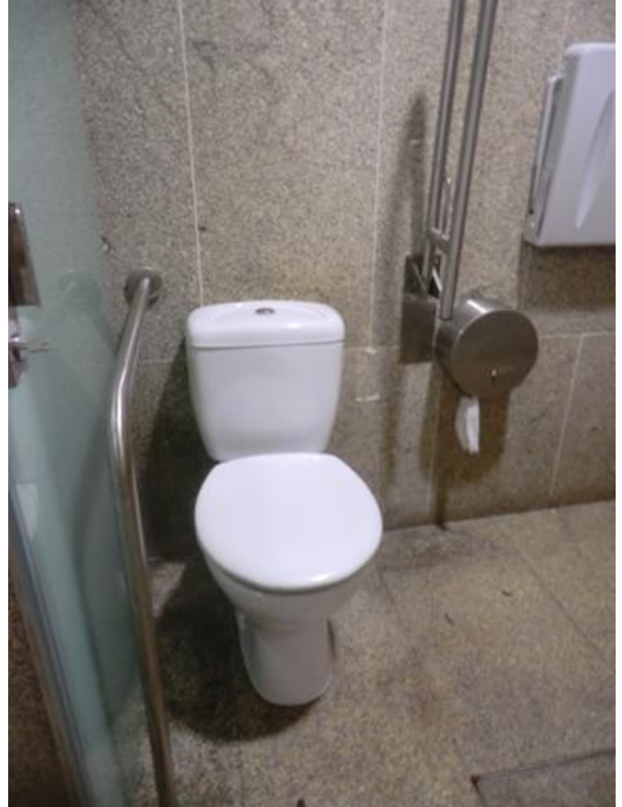
Aseo adaptado para PMR