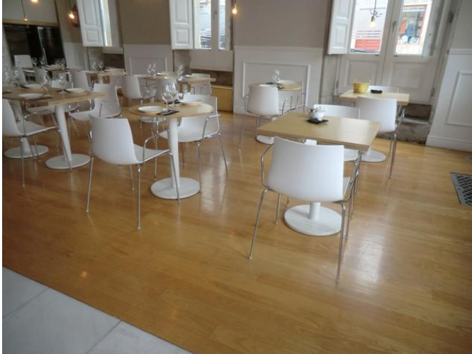
zona de masas, salón comedor