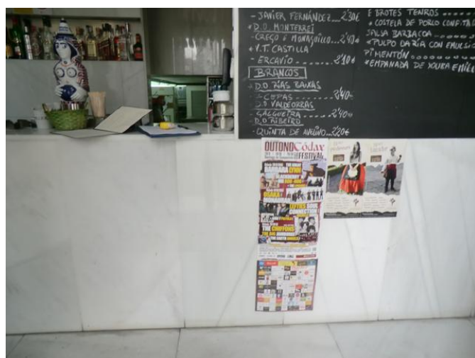
Zona de barra