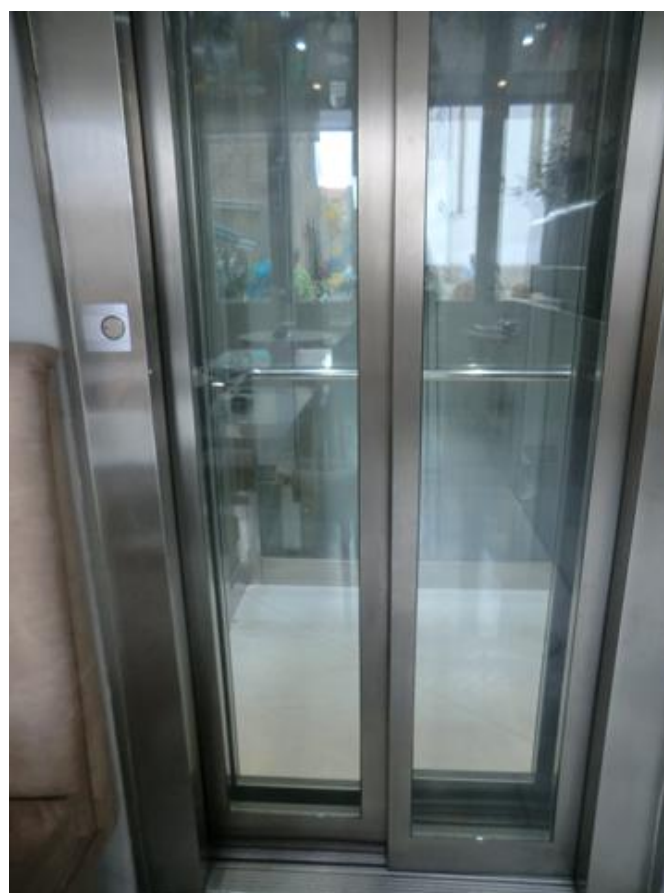
Cabina del ascensor para subir al restaurante