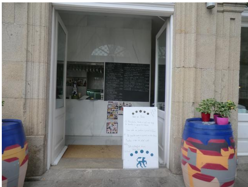
Acceso a la puerta de entrada al restaurante