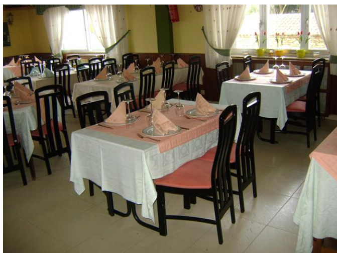
zona de masas, salón comedor