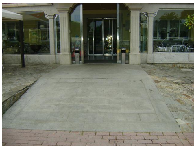
Rampa y puerta de acceso al interior del restaurante