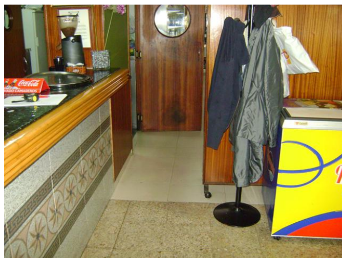
Zona de barra