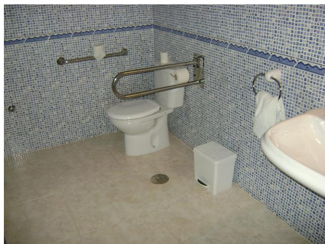
Aseo adaptado para PMR