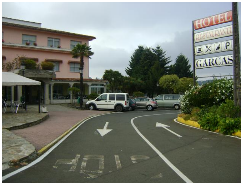
Fachada y entorno del edificio