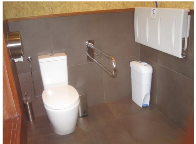
Cabina de Aseo Adaptado