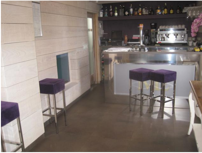
Bar - Cafetería