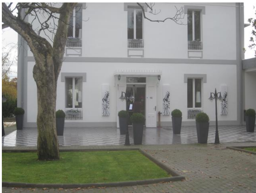
Fachada del Edificio