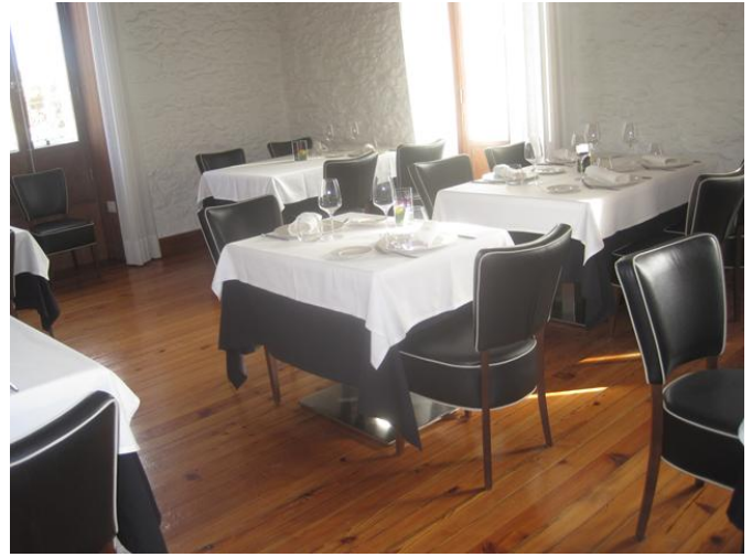
Area de Mesas