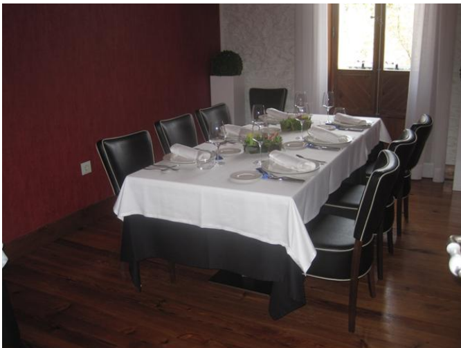
Mesas Salón Comedor