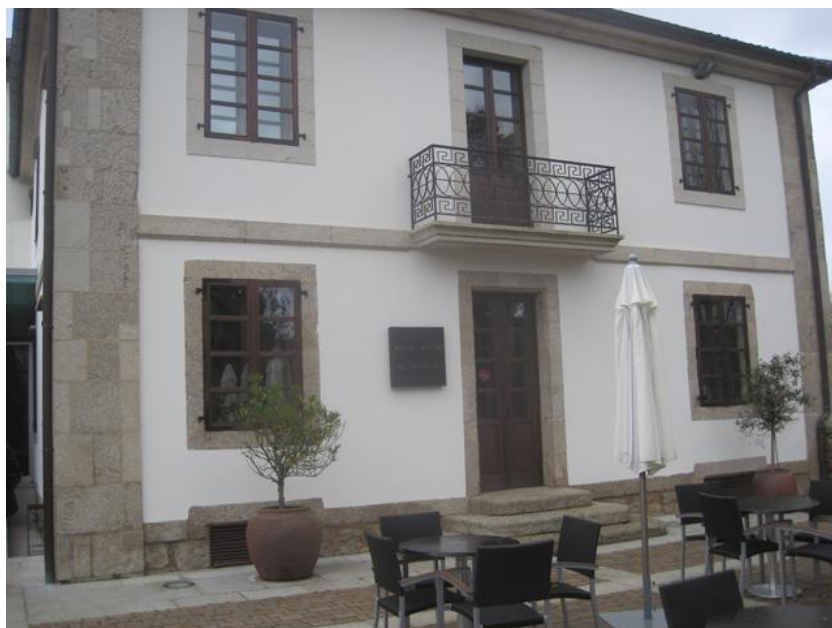
Fachada del Edificio