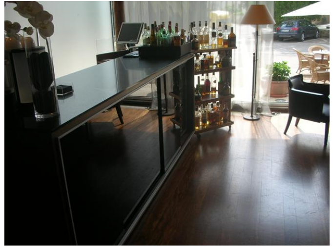
Barra del Bar