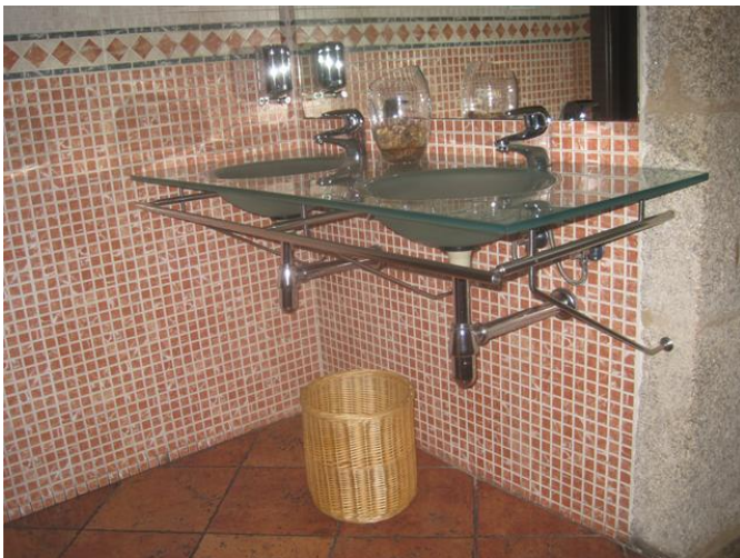
Lavabo del Aseo Adaptado