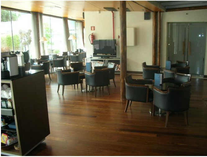
Área de Descanso y Bar