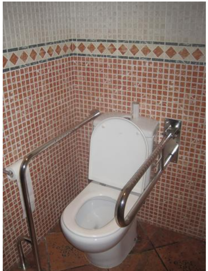
Cabina del Aseo Adaptado