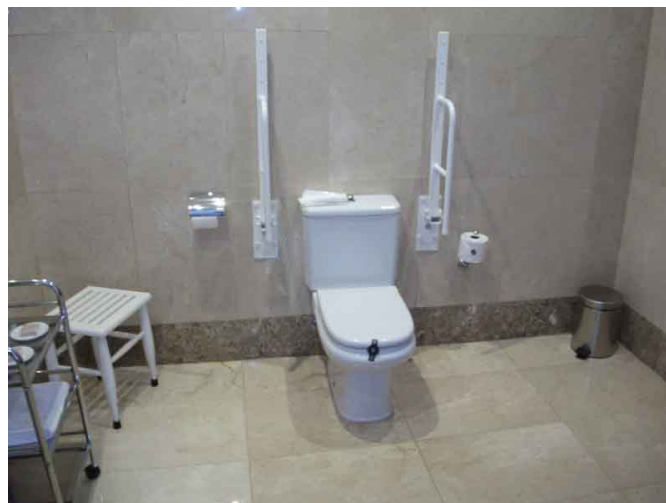
Cuarto de baño de la habitación adaptada