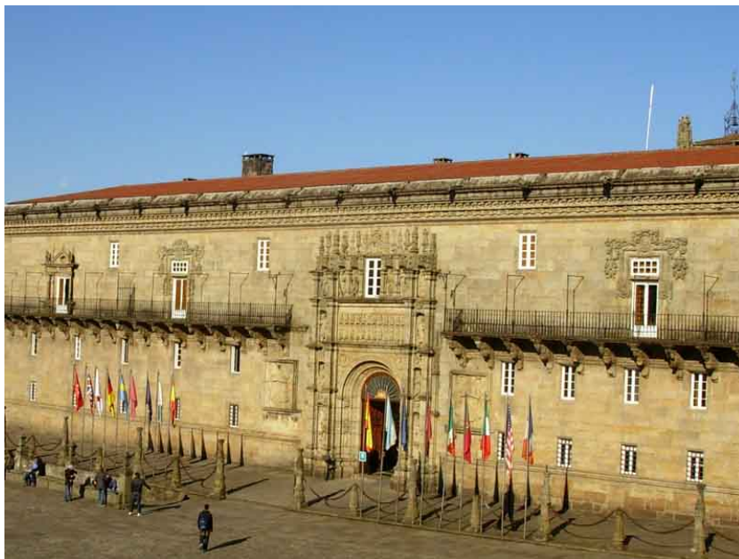
Fachada principal del parador