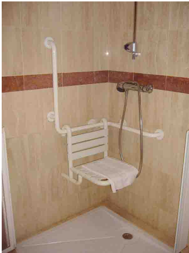
Ducha del cuarto de baño de la habitación adaptada con asiento fijo y abatible