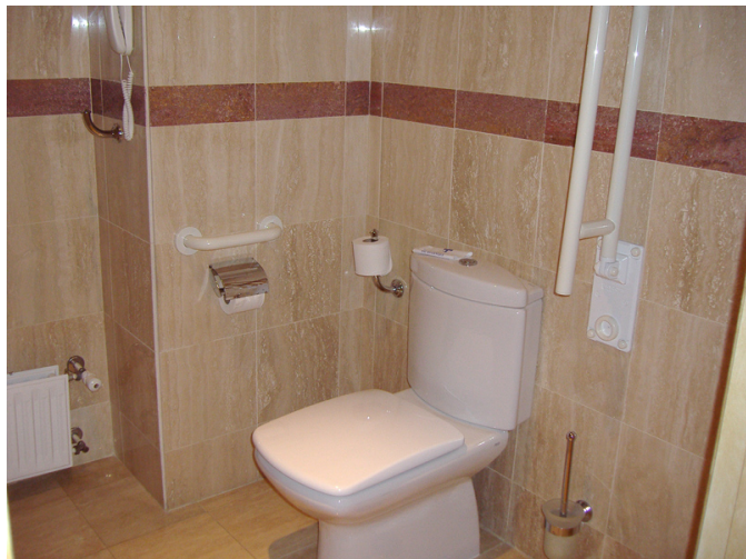
Cuarto de baño de la habitación adaptada