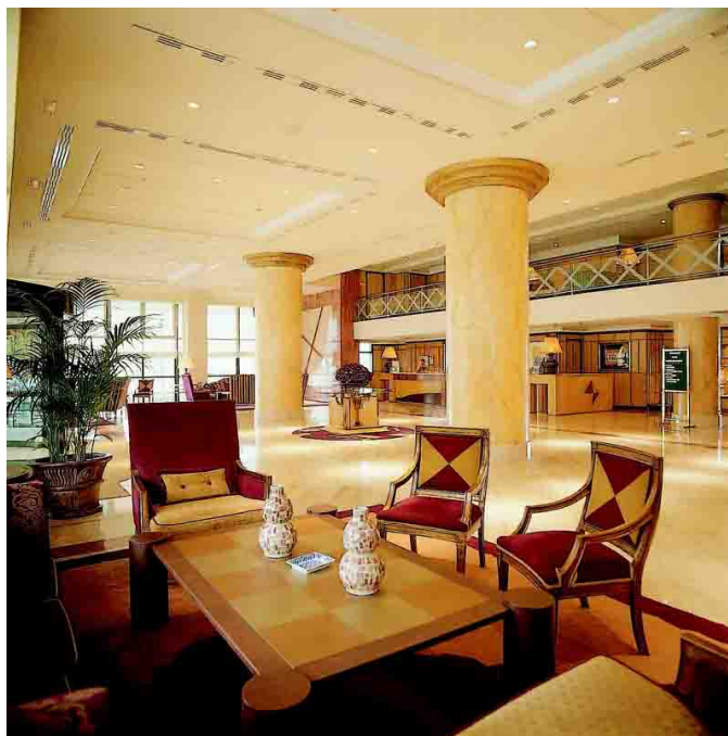
Recepción y hall