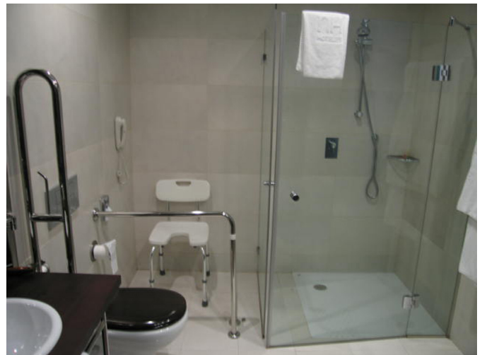
Inodoro con barras de apoyo