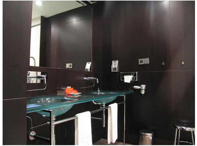
Cuarto de baño de la habitación adaptada