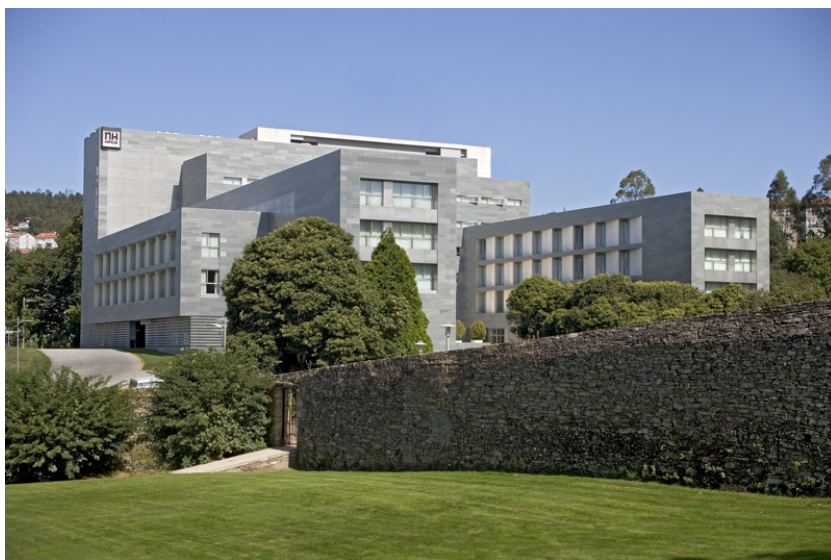
Fachada del hotel