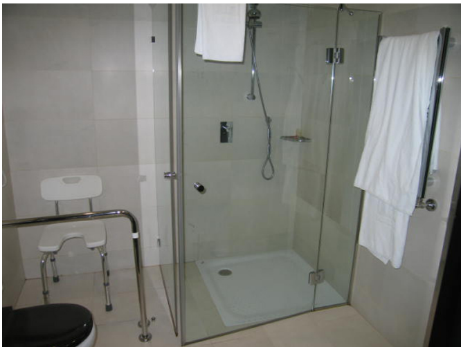
Ducha del cuarto de baño con silla homologada