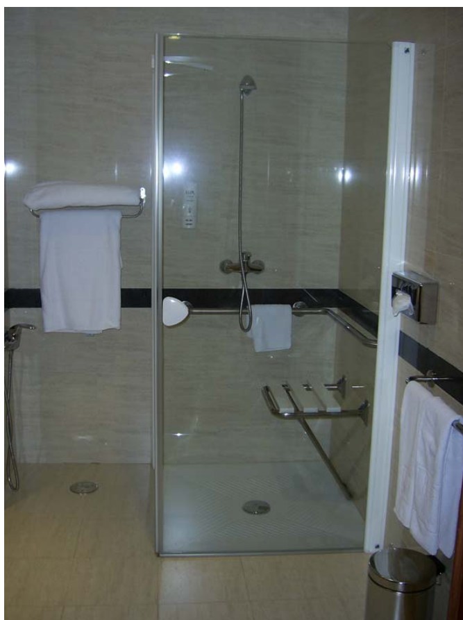
Ducha del cuarto de baño de la habitación adaptada