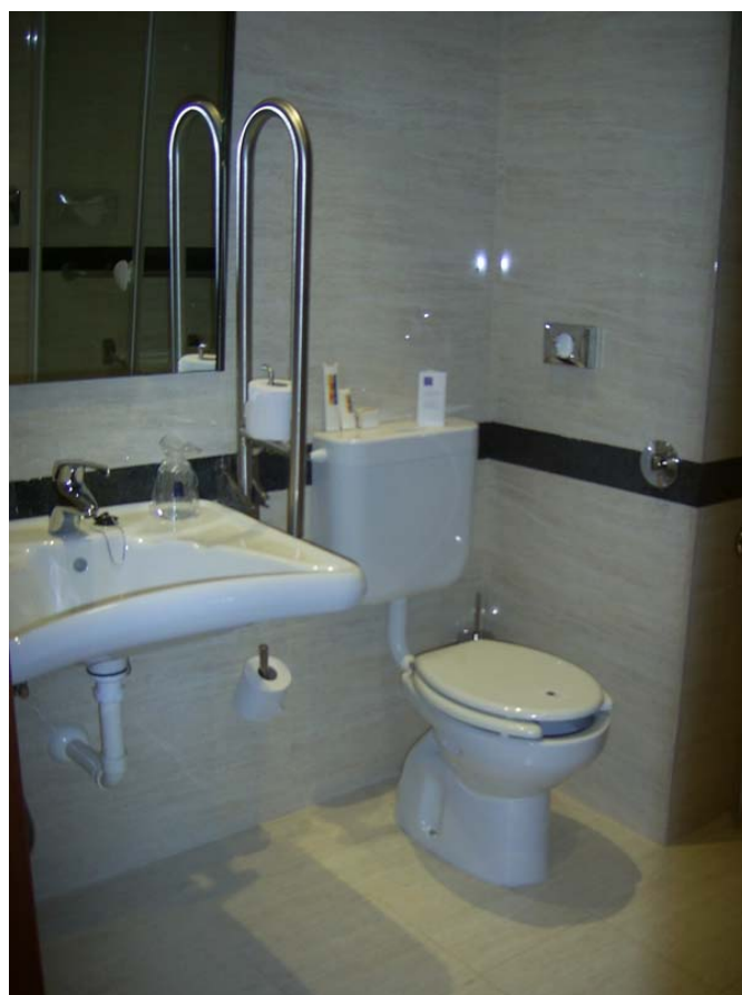
Cuarto de baño de la habitación adaptada