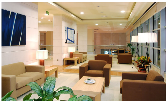
Hall de recepción